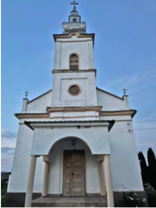
Biserica Ortodoxă din Buhani