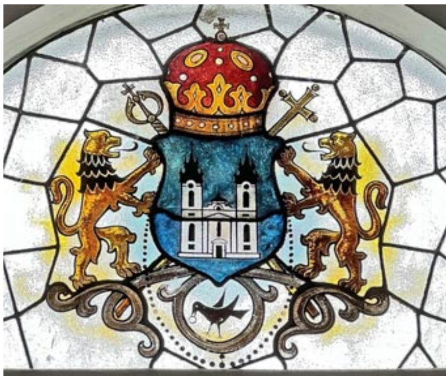
Stema Episcopiei Aradului, Ienopolei, Hălmaagiului și Hunedoarei (Vitraliu de la Reședința eparhială)