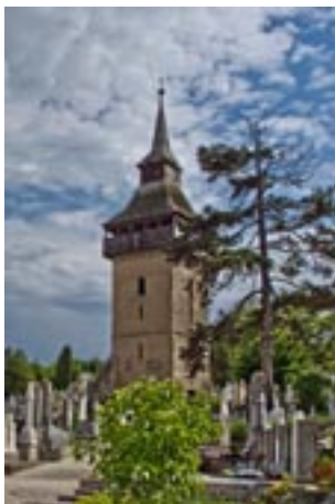
Turnul vechii biserici de „pe Vale” (1727)