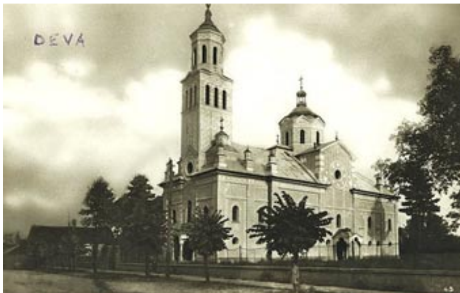
Biserica „Sfântul Ierarh Nicolae” după renovarea interbelică