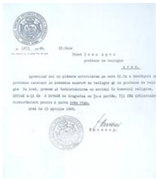
Distincție – brâu roșu (15 aprilie 1948)