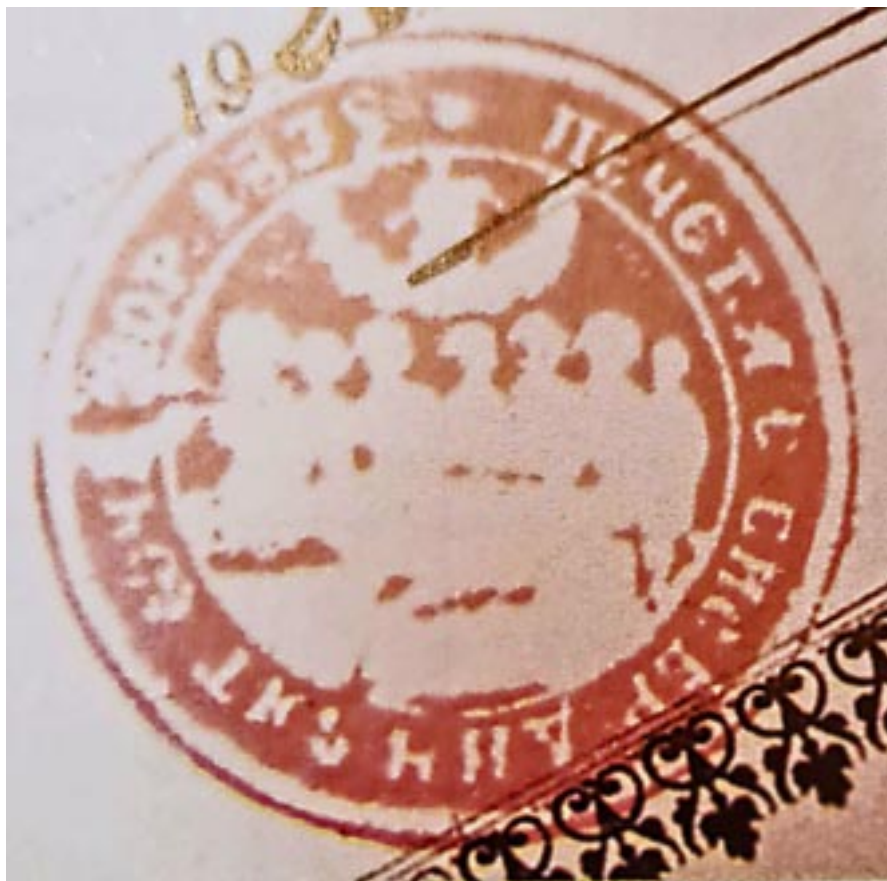
Sigiliul Bisericii „Adormirea Maicii Domnului” din Ocișor (1839)