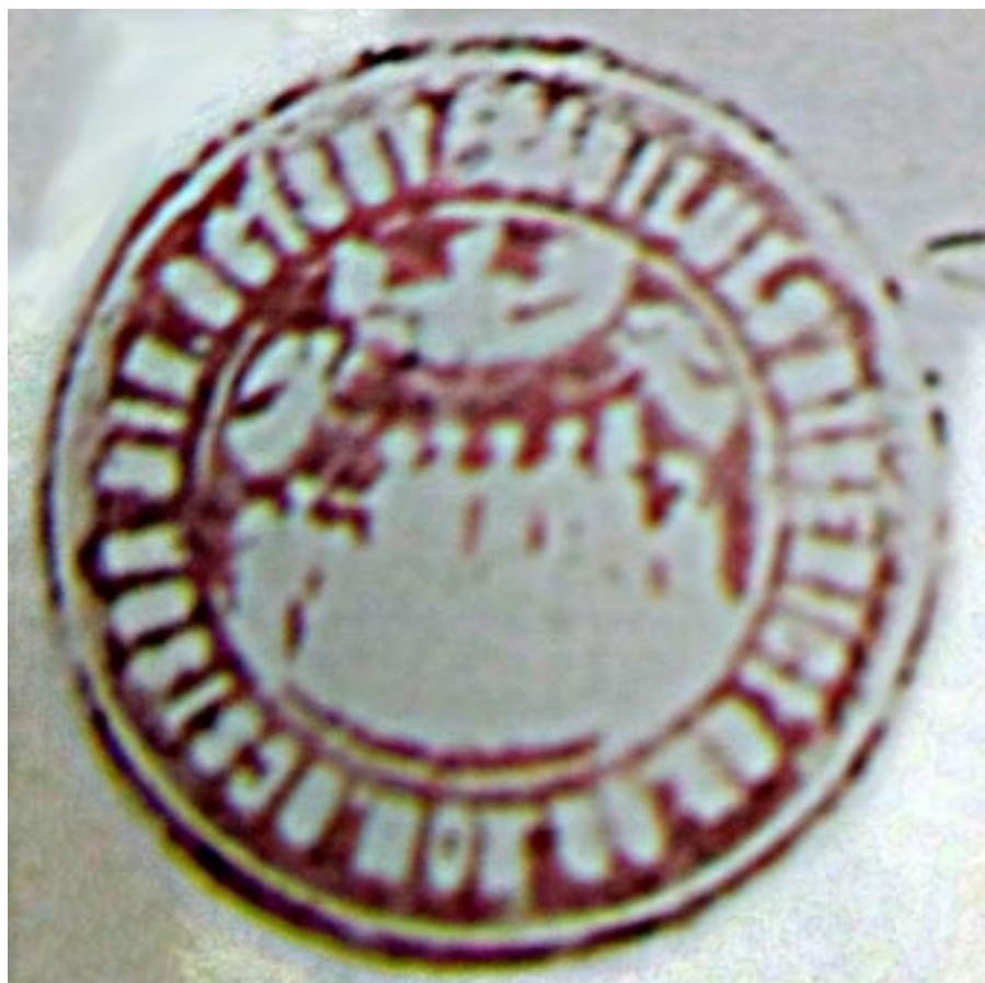
Sigiliul Bisericii „Adormirea Maicii Domnului” din Ocișor (a doua jumătate a secolului al XIX-lea)