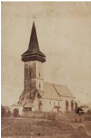
Biserica medievală din Deva (azi dispărută)