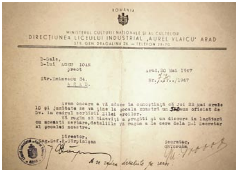
Adresă, Liceul Industrial „Aurel Vlaicu” Arad (20 mai 1947)