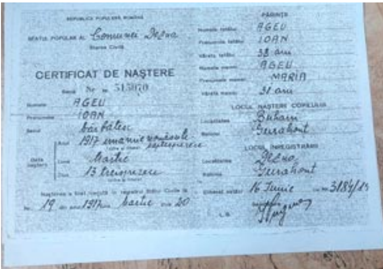
Certificat de naștere