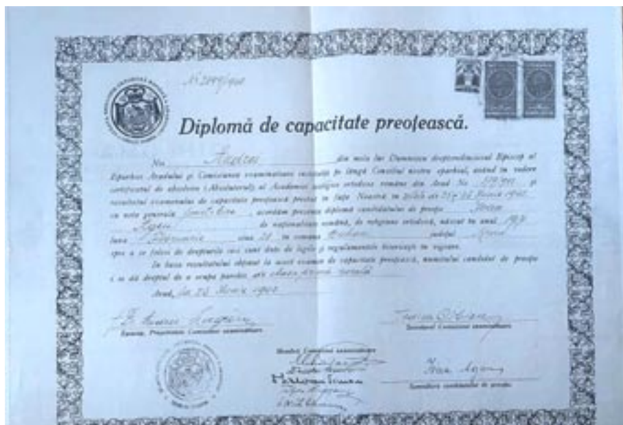
Diplomă de Capacitate Preoțească (26 iunie 1940)