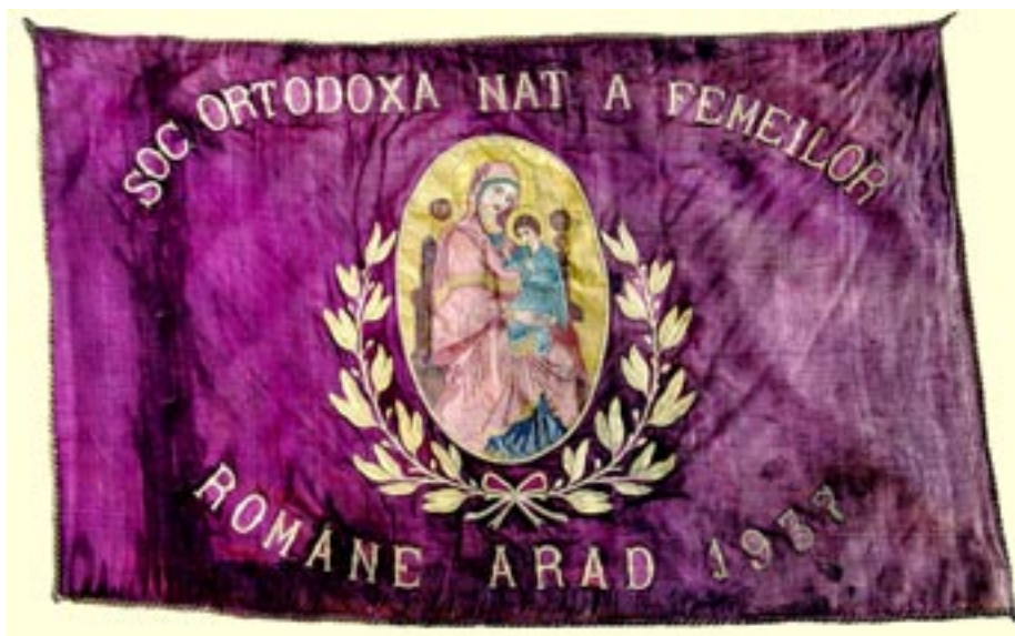
Steagul Societății Ortodoxe Naționale a Femeilor Române Arad, 1937 (avers)