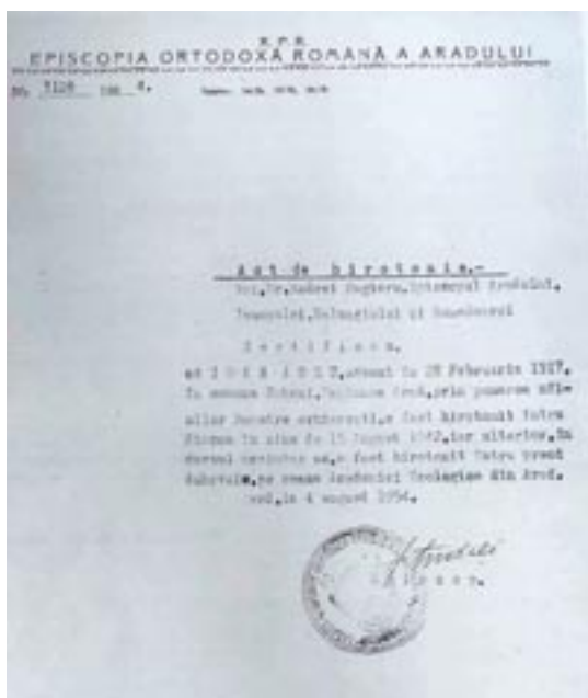
Act de hirotonie (4 august 1954)