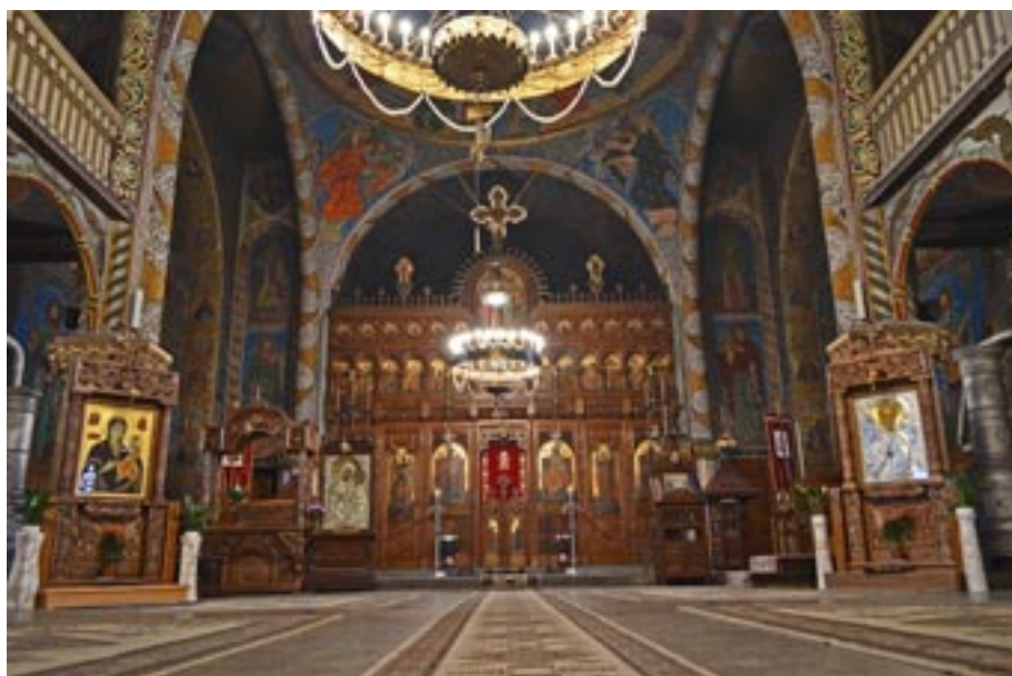
Interiorul catedralei episcopale din Deva