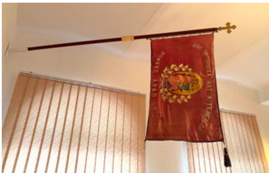
Steagul Societății Ortodoxe Naționale a Femeilor Române Arad (1937)