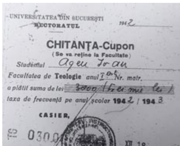
Chitanță – Cupon de achitare a taxei de școlarizare pe anul școlar 1942-1943 (Facultatea de Teologie din București, 1942)