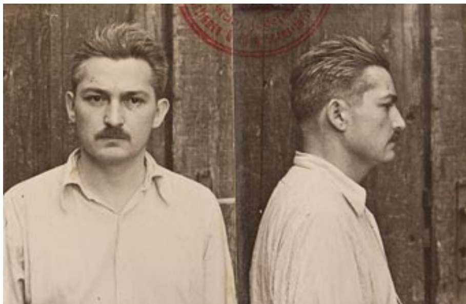
Poză din perioada de detenție (1949)