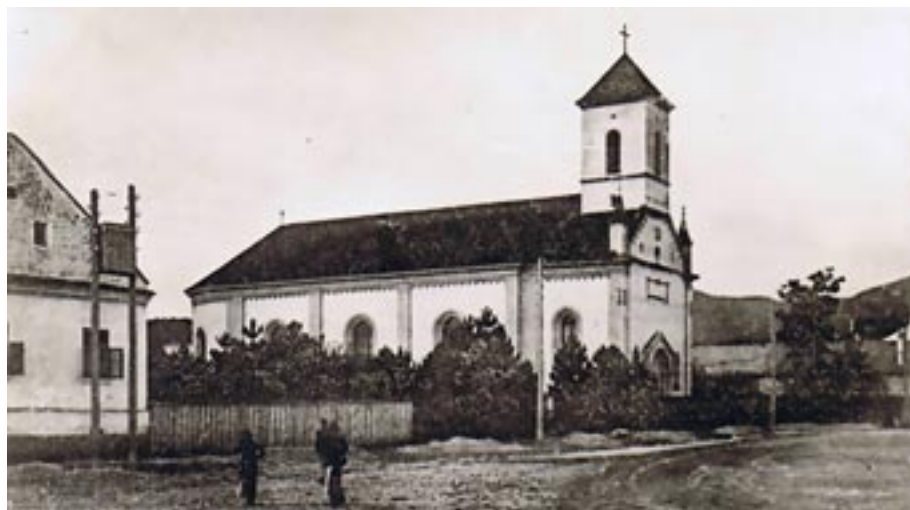
Biserica „Sfântul Ierarh Nicolae” din Deva (1861-1873) – aspectul inițial