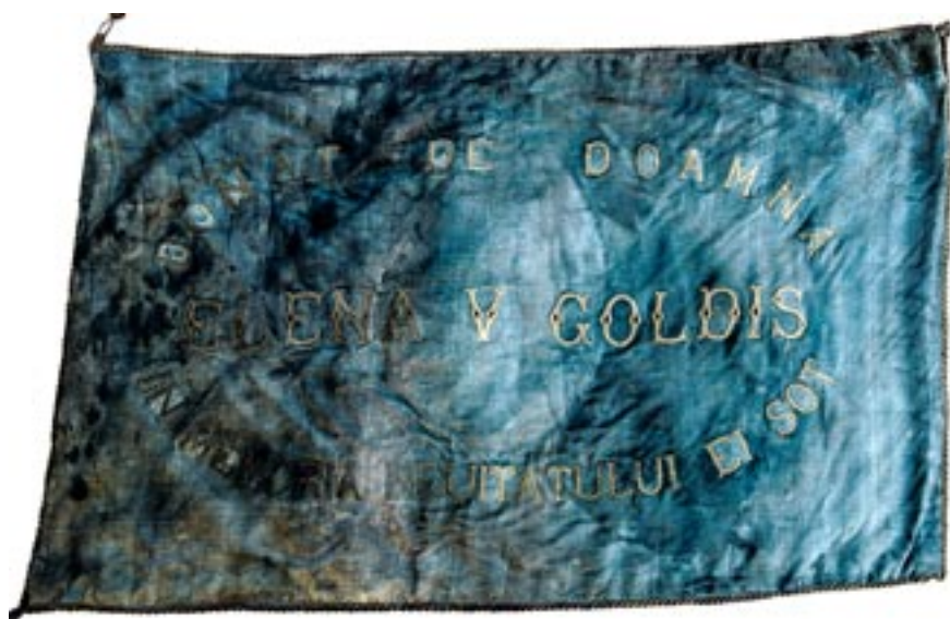
Steagul Societății Ortodoxe Naționale a Femeilor Române Arad, 1937 (revers)